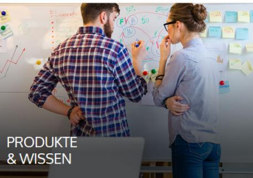
PRODUKTE & WISSEN