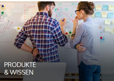
PRODUKTE & WISSEN