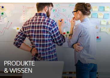
PRODUKTE & WISSEN