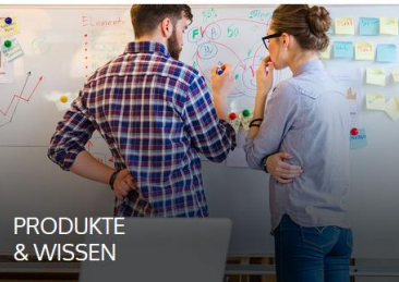
PRODUKTE & WISSEN