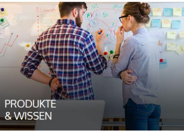
PRODUKTE & WISSEN