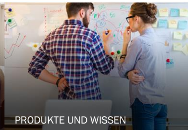
PRODUKTE UND WISSEN